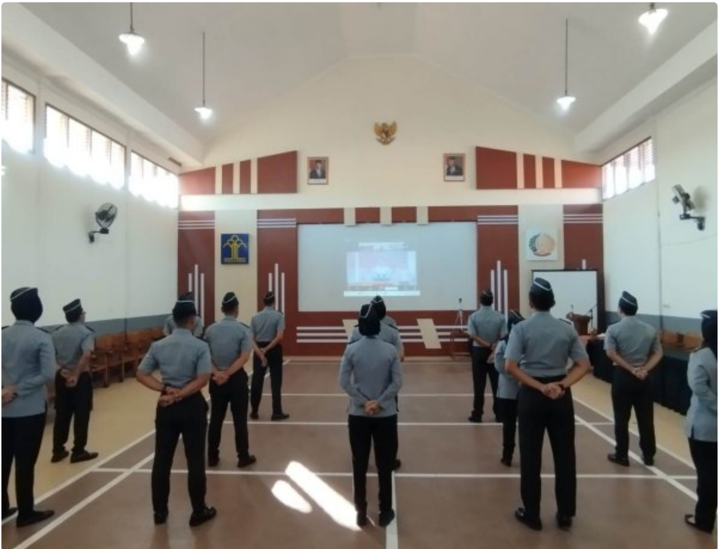
Rutan Blora Ikuti Apel Pagi Perdana Menkumham RI secara Virtual

Blora - Rumah Tahanan Negara (Rutan) Kelas IIB Blora mengikuti kegiatan Zoom Apel Perdana Menteri Hukum dan Hak Asasi Manusia Republik Indonesia,